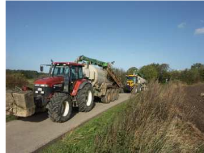
Trecker mit Gewichtsklotz und Güllefass