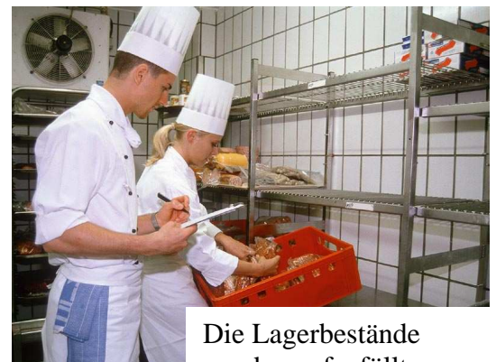
Die Lagerbestände werden aufgefüllt