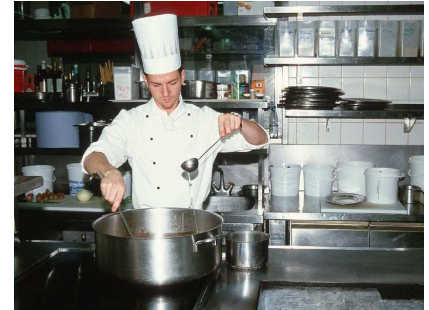
Beim Vorbereiten einer Soße